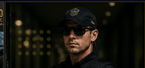
PRESENCIA DISUASIVA REAL