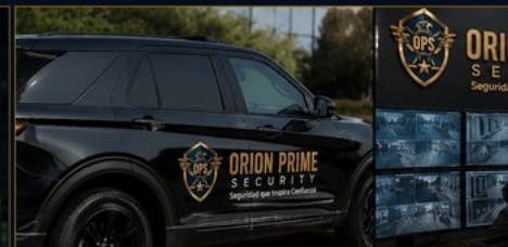
UNIDAD MOVIL CON GPS